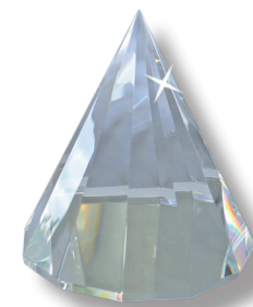
78 x 80 mm

Im geobiologischen Bereich dient die LANTOS PYRAMIDE zur Harmonisierung einzelner Räume. Sie harmonisiert im Umkreis von 3.5 m (7 m Durchmesser) alle Arten von geopathischen Einflüssen inkl. niederfrequentem Elektromog.