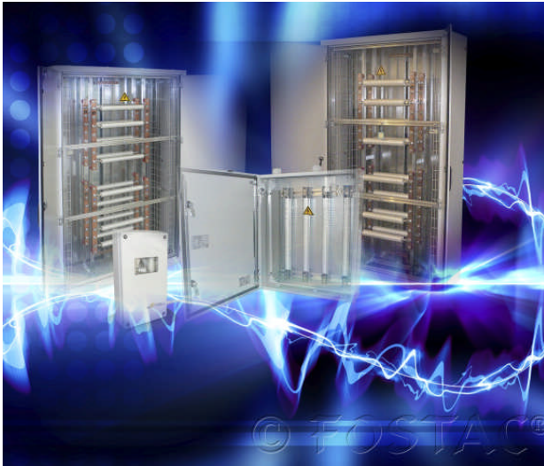
Fostac-Maximus-Geräte sind in verschiedenen Dimensionen verfügbar.

auf eine Bewusstseinsstufe, in welcher die Liebe und das Wohlergehen aller und von allem im Zentrum des menschlichen Bemühens stehen.